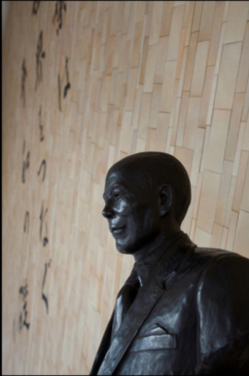
写真下：神田外語大学1号館エントランス にある佐野公一先生の胸像

前出の雑誌『中央公論』が出版されたのは、公一の死のわずか1カ月前だった。公一は、日本の社会全体が政治的な議論ばかりに偏り、教育の根源的なものが忘れられてしまっていると指摘したうえで、自らの決意を述べている。