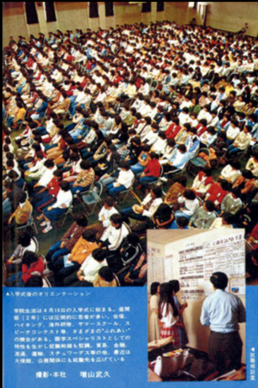
A 入学式のオリエンテーション

学院生活は4月19日の入学式に始まる。最初の2年(2年)には圧倒的に苦者が多い。合宿、ハイキング、海外研修、サマースクール、スピーチコンテスト等、さまざまな“ふれあい”の機会がある。留学スペシャリストとしての特色を生かし就職前課も英語、貿易、金融、流通、運輸、ソフトウェア等の特長。業界は大学前、卒業後も就職先も広がっている