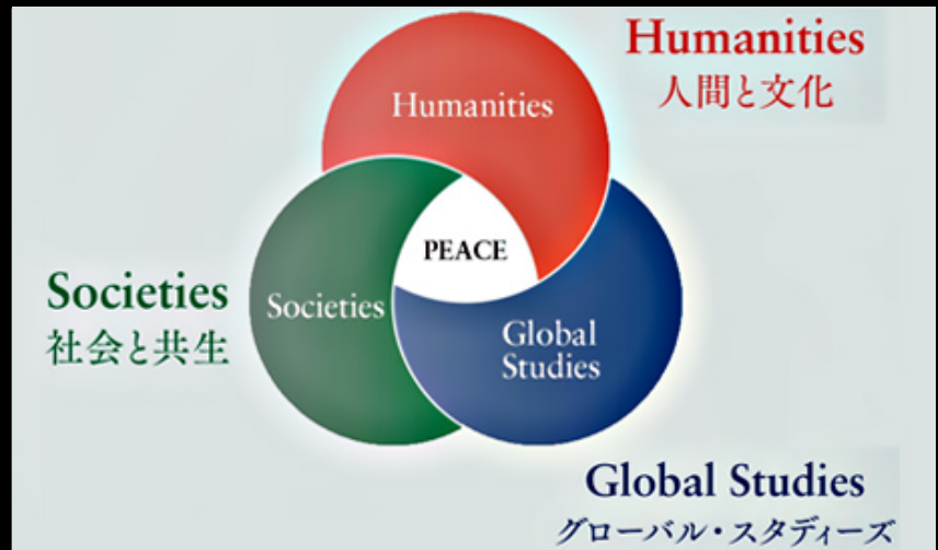
【図表：グローバル教養3つの領域】

「Humanities（人間と文化）」は、文学や宗教、歴史、思想など人間の文化的な営みについて学び、多様な世界観と価値観への柔軟な思考を身につける。