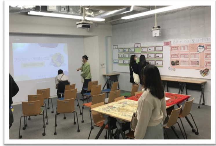
ゼミによる教室発表