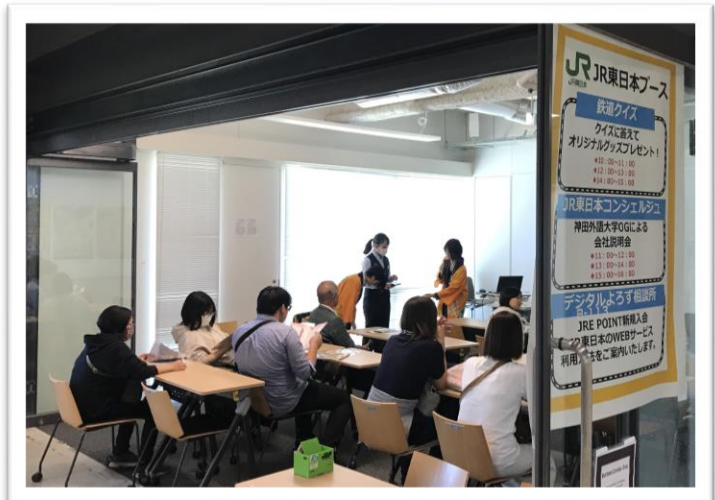
JR東日本グループ協力のキャリア関連プログラム