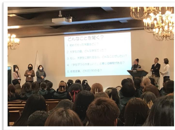
所属学科教員との交流