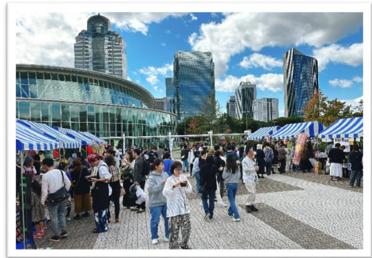
来場者でにぎわうテント出店ブース