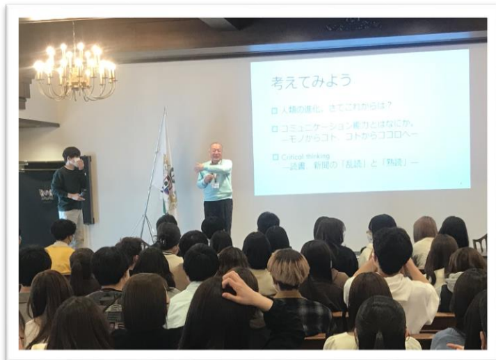
学長からのウェルカムメッセージ