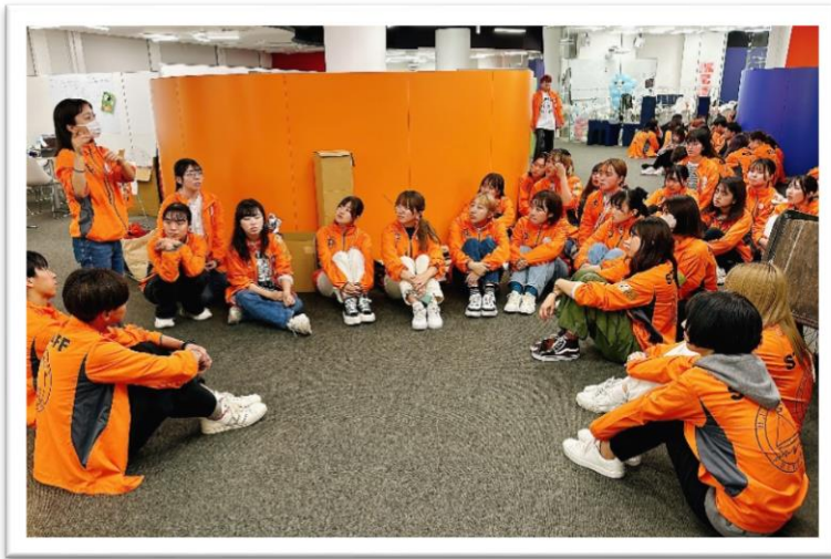
浜風祭委員会に所属する学生が打ち合わせをする様子