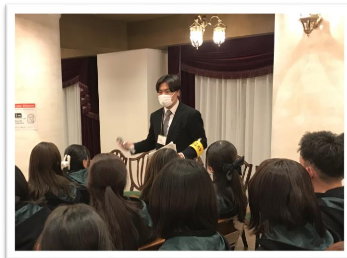
先輩学生と語ろう