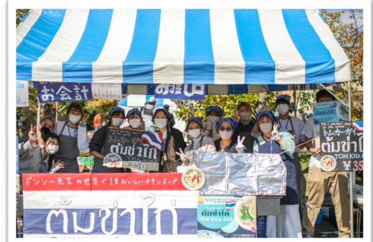
専攻言語の教員と学生による現地名物食