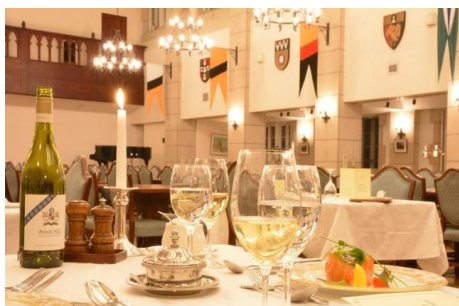
▲ リフェクトリー会場/GW限定スペシャルディナー

今年のご夕食を2会場(リフェクトリー/フォルスタッフパブ)から選べ、リフェクトリー会場ではアンガスビーフのローストを中心とした「GW限定スペシャルディナー」、フォルスタッフパブ会場では牛ロースカットステーキを中心とした「シーズナルディナー」をご提供。ご朝食は、リフェクトリーにてbuffetスタイルのお食事になります。