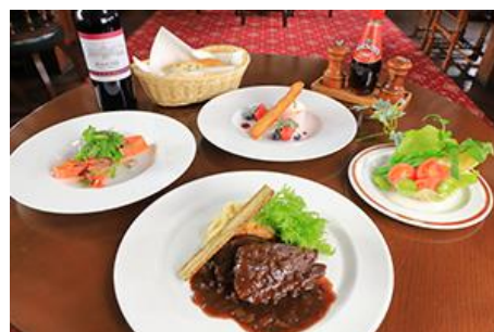
▲ フォルスタッフパブ会場/シーズナルディナー