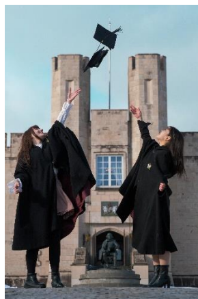
▲ オリジナル卒業証書、卒業帽・マントで写真撮影