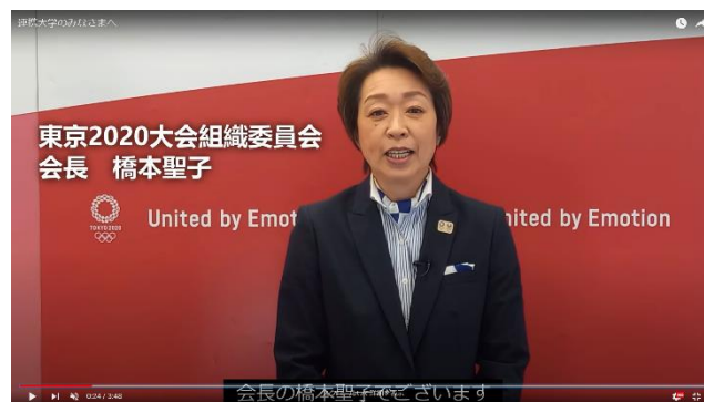
▲ 東京2020オリンピック・パラリンピック競技大会組織委員会 橋本聖子会長よりビデオメッセージ

東京2020オリンピック・パラリンピック競技大会において、本学の学生221名（推定）が大会ボランティアや都市ボランティアなど多岐にわたった活動に従事し、外国語運用能力はもちろん、異文化理解力、通訳スキル、地理や街の情報など、さまざまなスキルや教養を駆使して大会を支援しました。