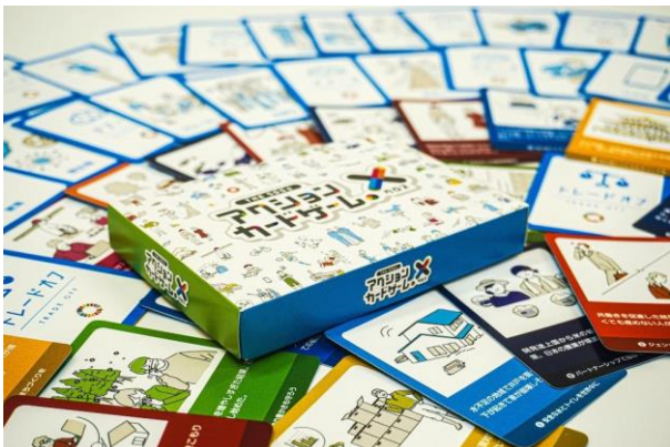
▲金沢工業大学開発の「SDGs カードゲーム X(クロス)」