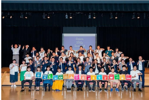
▲2019年8月開催の「ジャパン SDGs サミット」の様子