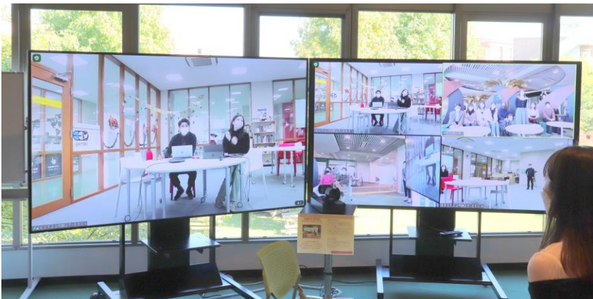
▲調印式で使用予定の多地点等身大接続システム「SmoothSpace」(上)とアバターロボット(右)