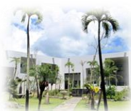
沖縄アミークスインターナショナル 幼稚園・小学校・中学校校舎

公立小学校で英語が教科となり、早期における英語教育への期待がますます高まっています。学習環境は子どもの能力の育成に大きな影響を及ぼすことで知られていますが、「英語イマージョン教育」を受けている子どもたちの学びはどのようなものでしょうか。本講演は、本学の「児童英語教員養成課程」の実習校である沖縄アミークスインターナショナル幼稚園・小学校の運営・教育に携わっているお二人をお招きし、同校の教育方針やカリキュラム、また教育現場、そして子どもたちの様子などをお話しいたします。