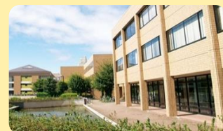
1号館 (右側) 外観