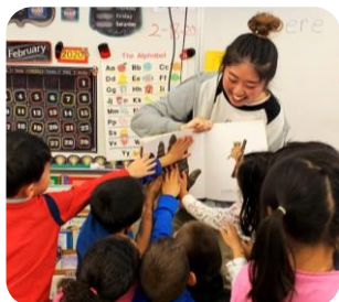
過去の実習の様子 上:「児童英語海外実習(アメリカ)」 下:「児童英語教育実習(沖縄)」