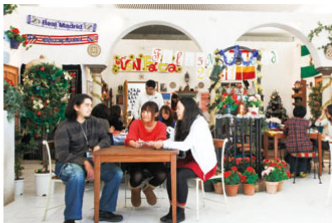
MULC スペイン語エリア

2008年、多言語コミュニケーションセンター(通称MULC)が設置される。スペイン語エリアは、パティオ(中庭)をイメージした内装で、そこにラテンアメリカの装飾品が彩りを添える。同センターの最大の特長は「談話空間」であり、3名のネイティブ語学専任講師が通常の教室での講義に加え、MULCにてスペイン語会話を個別に指導する。さらにスペインやメキシコからの留学生も談話空間に協力している。学生は授業外の好きな時間に会話を練習することができ、ネイティブ教員や留学生との談話を楽しみながらスピーキング力を磨く。また、先輩学生が後輩にスペイン語を教えたり仲間同士で自習したりと、学生間の交流の場ともなっている。語学専任講師は、「談話空間」のみならず、それぞれの出身地の文化(食や祭り)を紹介するイベントや映画鑑賞会などを企画し、学生の異文化理解を促している。このような語学専任講師の尽力と熱意により、MULCは本学のスペイン語教育にとって欠かせない存在となっている。